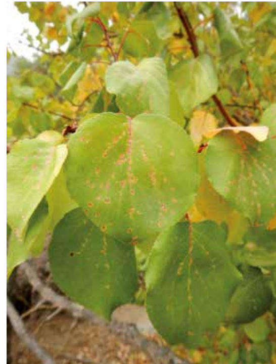
Escama del olivo en hojas de damasco.