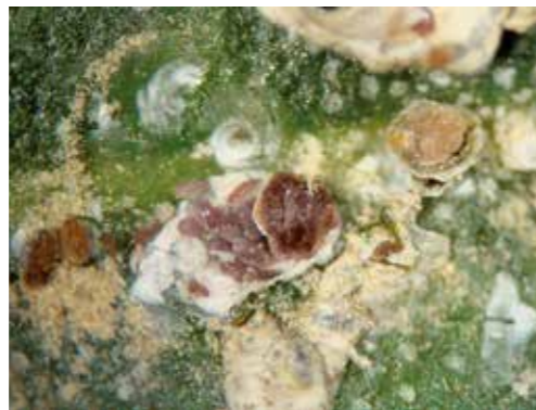
Detalle de cuerpo de Parlatoria oleae .

Los huevos son de color violeta a púrpura y las ninfas son de forma oval y color violeta oscuro. Su tamaño es reducido (cerca de 0,3 mm).