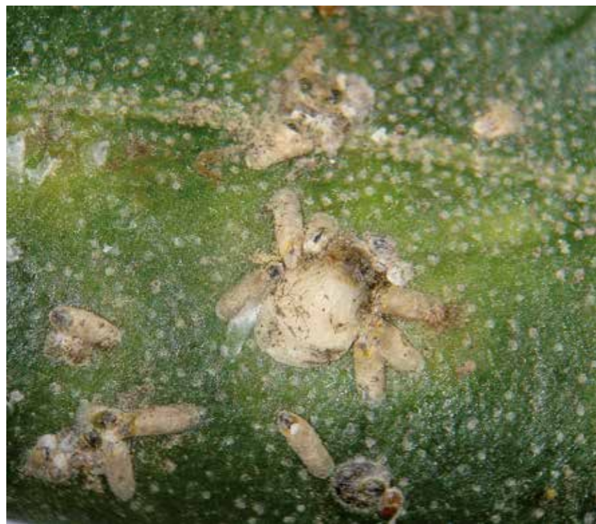
Hembras y machos de Parlatoria oleae .