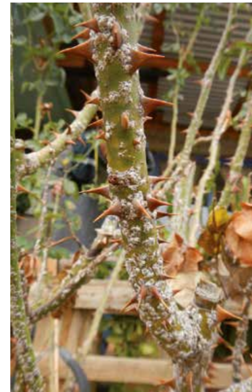
Altas poblaciones de la escama en rosa.