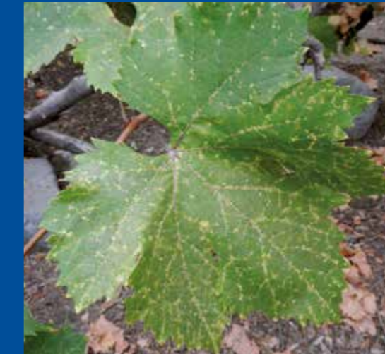
Escamas en follaje de vid, huertos caseros.

Si usted detecta esta plaga, por favor avise al SAG.