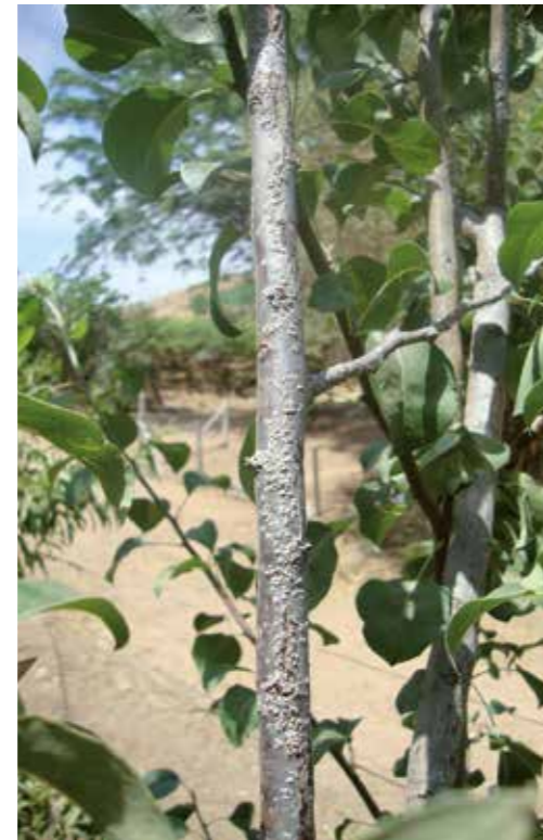
Escama del olivo en peral.

Es una plaga que ataca a una gran cantidad de especies frutales y ornamentales. A la fecha, en Chile se ha detectado preferentemente en frutales como olivo, damasco, duraznero, ciruelo, manzano y peral. En plantas ornamentales se encuentra en forma abundante en rosa y ligustrina.