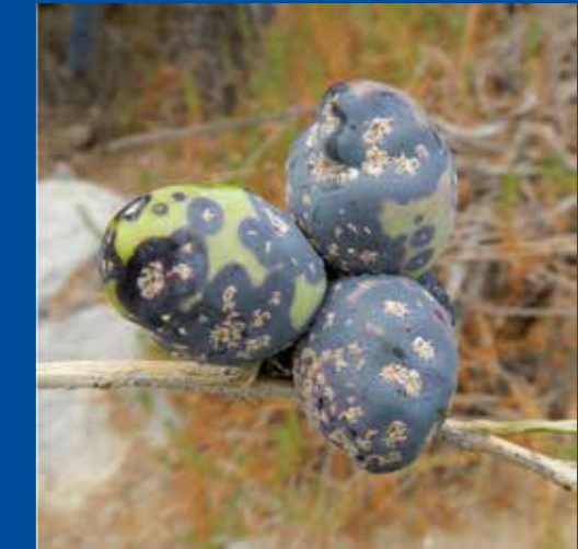
Olivos deformes y manchados por la escama del olivo.