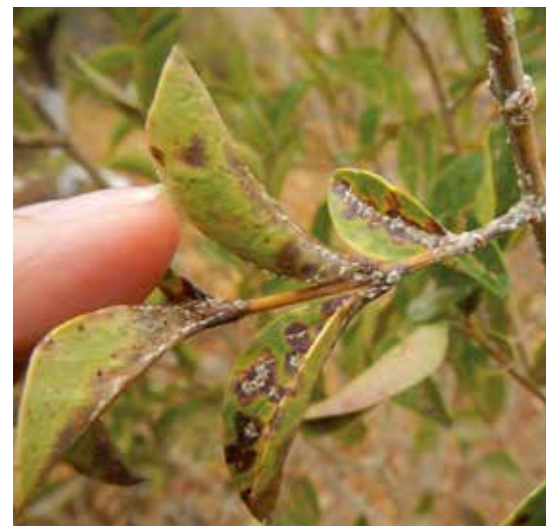
Escama del olivo en hojas de ligustrina.