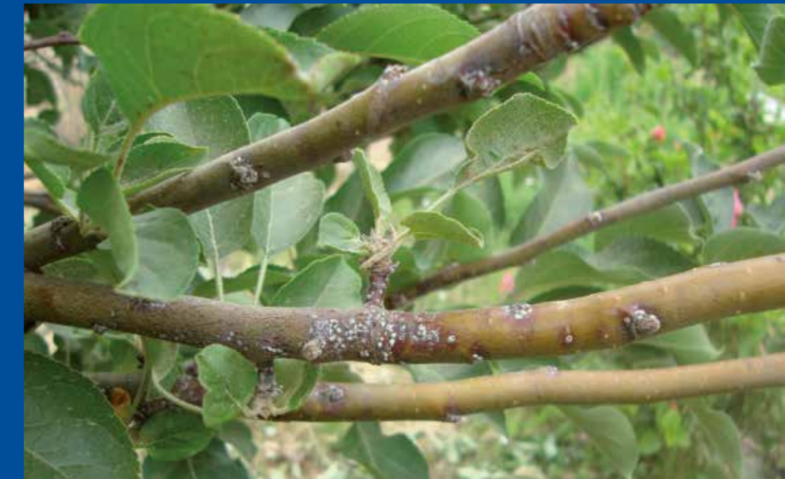
Ramillas de manzano afectadas por la escama del olivo, aureolas de color púrpura alrededor de la escama.